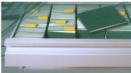
Szuflada szafy na indeksy