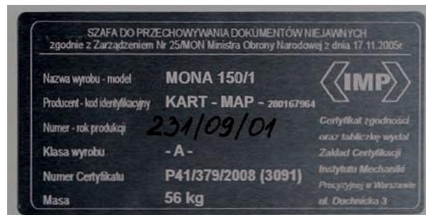
Tabliczka znamionowa szafy wzmocnionej