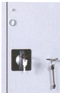
Zamek szafy wzmocnionej

Szafy posiadają Certyfikat Instytutu Mechaniki Precyzyjnej